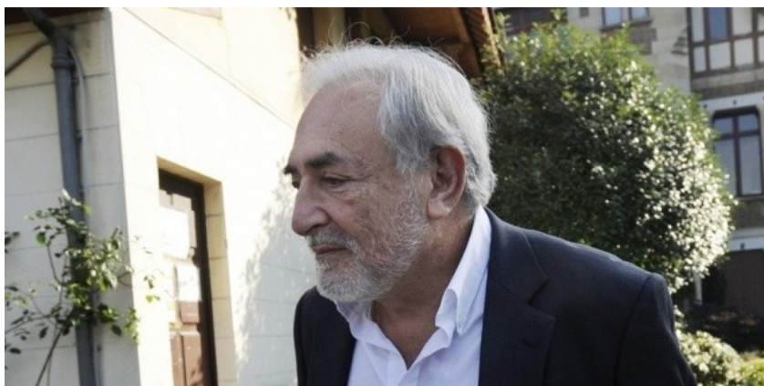
Dominique Strauss-Kahn, à Sarcelles, le 16 octobre 2011.

Comment l'ex-favori pour l'élection présidentielle s'est-il laissé entraîner dans cet étrange réseau de libertinage ? Enquête sur un engrenage fatal.